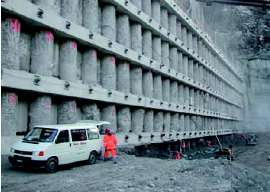
Abb. 2: Die rund 30 Meter hohe Bohrfahlwand.

punktfeld besteht aus circa 40 Lage- und Höhenfixpunkten rund um den Portalbereich. Davon befinden sich 10 Punkte auf oder an Gebäuden in der Talsohle in Entfernungen von bis zu 600 Metern vom Portal. Die vorfabrizierten Messpfeiler konnten mit einem lokalen Helikopterunternehmen auf die Flachdächer transportiert werden. Die Punkte im Fels über dem Portal mussten mit Klettereinsätzen versichert werden (Abb. 3). Das Fixpunktnetz ist zwangsfrei im übergeordneten Netz GBT gelagert.