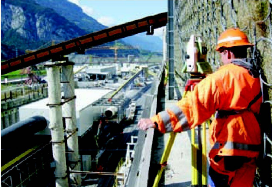
Abb. 4: Geodätische Vermessung auf der Bohrpfahlwand (Foto: Basler & Hofmann).

im Tagbautunnel versichert werden. Seit-her werden laufend Folgemessungen ausgeführt.