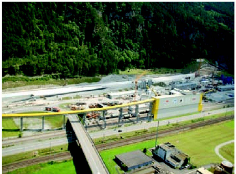
Abb. 1: Der Portalbereich bei Erstfeld: Die Bohrpfahlwand rechts sichert den Hangbereich unmittelbar vor dem bergmännischen Tunnelportal, links davon ist bereits der Tagbautunnel erstellt. Förderbänder und der Installationsplatz umgeben die Baustelle.

Das eigentliche Nordportal des Gotthard-Basistunnels liegt dort, wo die Linienführung auf kompakten Fels trifft und der Tunnel bergmännisch ausgebrochen werden kann. Davor erstreckt sich ein 600 Meter langer Tagbautunnel, der in die Bergflanke aus Lockergestein eingebettet ist (Abb. 1). Um die Setzungen durch die Auflast des späteren Tagbautunnels möglichst gering zu halten, wurde der gesamte Bereich vorgängig mit meterhohen Aufschüttungen vorbelastet. Direkt vor dem bergmännischen Tunnelportal muss auf einer Länge von rund 200 Metern der Hanganschnitt für den Bau des Tagbautunnels mit armierten, bis zu 30 Meter hohen Bohrpfählen gesichert werden, die mit Longarinen in mehreren Lagen im Fels verankert sind (Abb. 2).