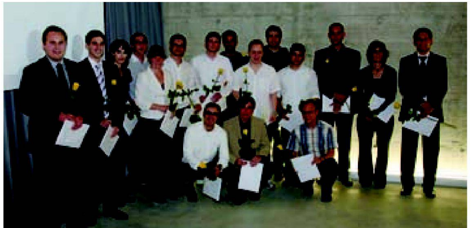
Absolventinnen und Absolventen des BSC in Geomatik FHNW 2010 mit den gerade überreichten Diplomen.

Am 24. September 2010 wurden in einer gemeinsamen Abschlussfeier aller Studiengänge der Hochschule für Architektur, Bau und Geomatik FHNW in den Räumen der Regent Beleuchtungskörper AG in Basel unter reger Beteiligung von Angehörigen der Absolventinnen