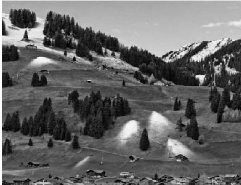
Abb. 2: Wenn der Schnee nicht mehr rechtzeitig fällt, legen Wintersportorte die erste Schneedecke künstlich an (Foto: R. Egli, Frutigen).

In den letzten Jahren hat im Alpenraum insbesondere das Schadenpotenzial stark zugenommen, also die Auswirkungen möglicher Ereignisse. Neben der Lage des Orts spielen die betreffende Wirtschaftsstruktur sowie das touristische Angebot und die Raumnutzung für die Gefährdung eine wesentliche Rolle. Aufgrund der oft zentralen Bedeutung des Tourismus und wegen der eher geringen Diversifikation der Wirtschaft wirken sich Störungen des