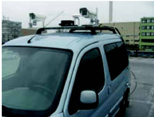
Abb. 2: Forschungsplattform Mobile-Mapping-IVGI mit Inertialmesseinheit (schwarzer Kubus), GPS-Antenne und Stereo-Bildsensoren.

matik) 22 Studierende (davon 7 weiblich) ihr Studium auf. Aktuelle Informationen zum Studium im BSc in Geomatik sind zu finden unter www.fhnw.ch/habg/ivgi/bachelor . Parallel zum BSc in Geomatik startete Mitte September der zweite Kurs des dreisemestrigen Master of Science in Engineering mit der Vertiefungsrichtung Geoinformationstechnologie (MSE-GIT). Aktuelle Informationen über Inhalte und Struktur des Masterstudiums in Geoinformationstechnologie sowie zu Anforderungen und Anmeldung sind auf der Studiengangsw Webseite www.fhnw.ch/habg/ivgi/master zu finden.