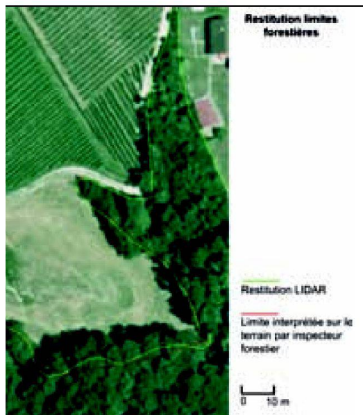
Fig. 4: Représentation des limites forestières sur fond orthophoto.

rapport aux exigences de la mensuration. Les écarts moyens sont de 1.4 m, alors que la tolérance fixe une limite à 1 m. Selon l'interprétation des données, les écarts maximaux (jusqu'à 7 m) sont considérables.