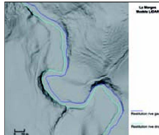
Fig. 1: Représentation de la restitution des limites LIDAR superposée au MNT de maille 0.5 m.

Sur les deux zones analysées, les écarts atteignent en moyenne des valeurs inférieures aux exigences de précision: 1 m pour des terrains en zone de tolérance NT4 et 50 cm pour des terrains en zone de tolérance NT3 [3]. En effet, les valeurs moyennes des écarts relevées entre la restitution LIDAR et le levé terrestre atteignent 0.3 m sur la zone 1 et 0.74 m sur la zone 2 (figure 2). Les écarts maximaux ont été observés à l'emplacement d'obstacles, comme des troncs tombés dans l'eau, et là où le lit du cours d'eau a naturellement évolué (cruie, glissements de terrain, etc.). Ainsi, la limite des hautes eaux peut s'être déplacée de 1 à 2 m dans