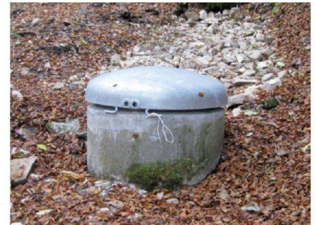
Fig. 5: Captage après assainissement.

Le projet prévoit environ 6000 places pour le gruyère et 1500 places pour le vacherin, pour un coût d'environ 4.2 millions de francs. Le projet sera réalisé en communauté avec la Société de laiterie de Charmey qui construira pour son compte une cave d'environ 3000 places de gruyère et le local de fabrication.