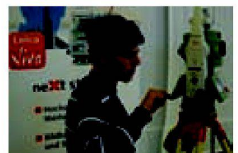
Erste Einblicke in die Leica Viva TS15 I.