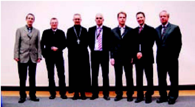
Fachreferenten mit Moderator.