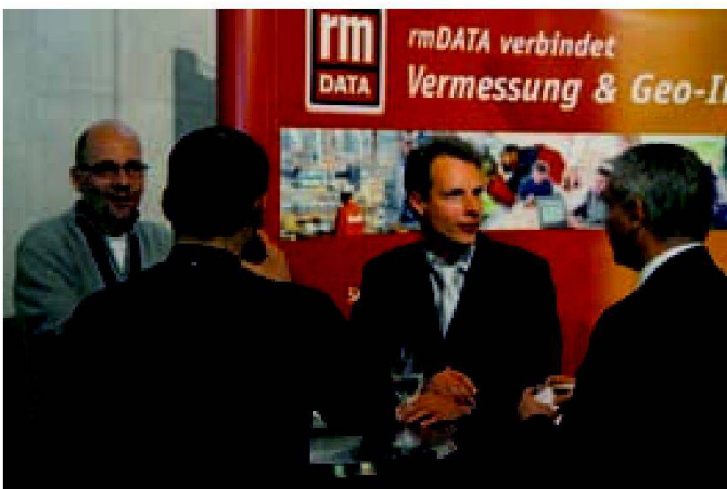
Reges Interesse an der Katasterlösung am rmDATA-Stand.

Die Firma rmDATA hat jahrzehntelange Erfahrung im Bereich Katastervermessung für Österreich. Sämtliche Vermessungsämter, al-