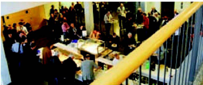
Mittagsbuffet mit Ausstellung.