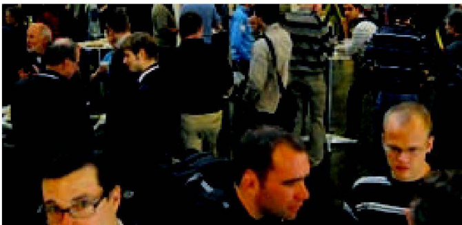
Ausstellung zusammen mit neun Partnerfirmen.