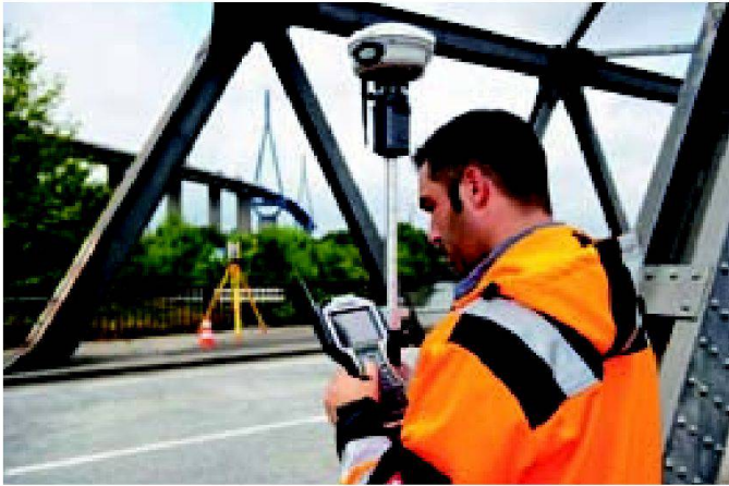
Abb. 2: Der ideale Feldcontroller zur Bedienung von Totalstation, GNSS oder IS-Rover, der Kombination aus beiden Systemen.

Trimble stellt seine Kontrolleinheit der nächsten Generation vor: den Trimble® TSC3 Controller. Als Bestandteil der Trimble Vermessungslösungen des Connected-Site™ Konzepts versetzt die neue Kontrolleinheit Vermessungsingenieure in die Lage, ihre Daten zu erfassen, sie gemeinsam zu nutzen und weiterzugeben, um auf diese Weise Genauigkeit, Effizienz und Produktivität bei ihrer Tätigkeit zwischen Feld und Büro zu steigern.