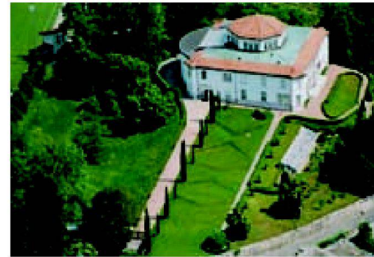
Museo Vincenzo Vela.

Der Park der Breggia-Schluchten zieht sich auf einer Strecke von etwa 1,5 km dem gleichnamigen Fluss entlang und deckt eine Gesamtfläche von 1,5 km 2 in den Gemeinden Baler-