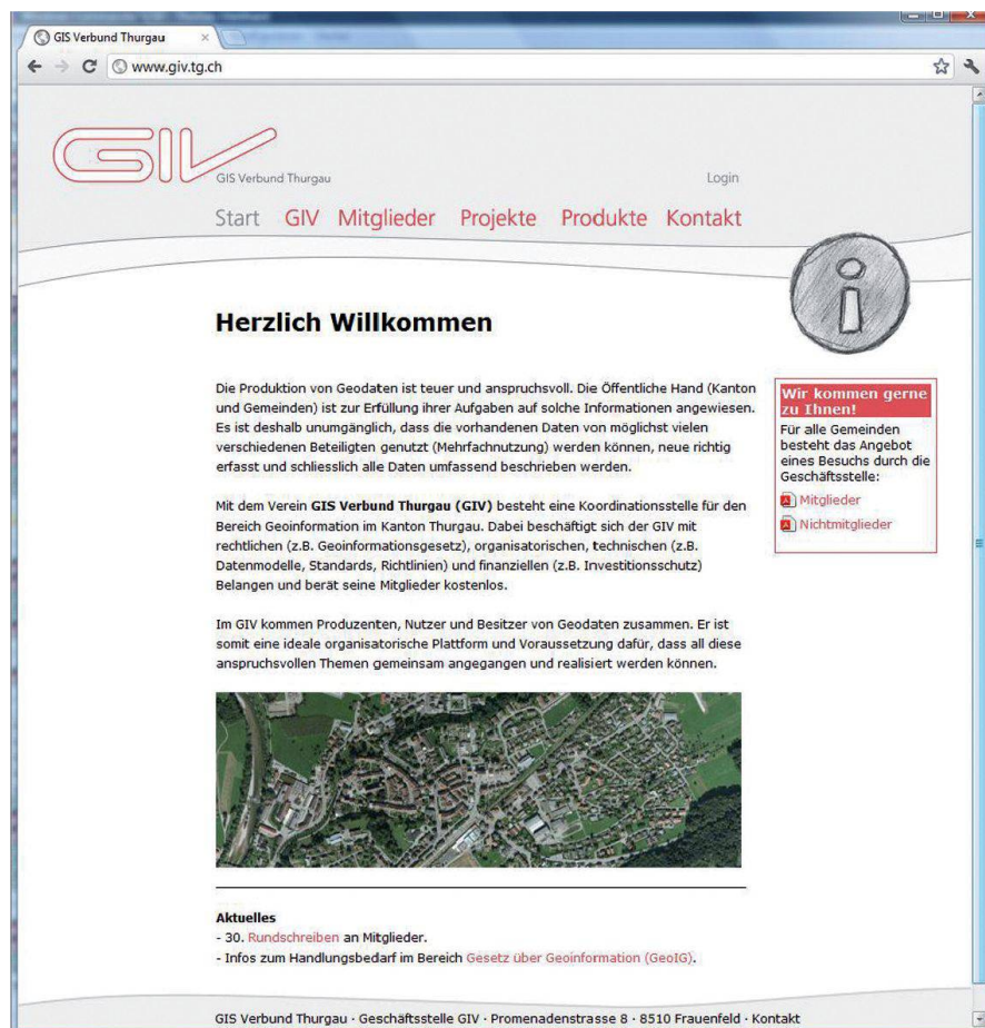
Abb. 2: Die Website des GIV wird rege als Informationskanal zu den Mitgliedern genutzt.

Ziele des GIV und des Kantons als Mitglied sind, dass die über etliche Jahre erarbeiteten Produkte und Dienstleistungen des Vereins (Normen, Standards, Datenmodelle, Arbeitsunterlagen, Checkertools, Veranstaltungen, Beratungen, usw.), die durch die Mitglieder (verschiedenste kantonale Stellen, Gemeinden, Ver-/Entsorger, unterschiedliche Ingenieurfachbereiche) im beruflichen Alltag täglich genutzt werden, wie bis anhin auch in Zukunft durch den Verein fachgerecht und zuverlässig produziert und auch ständig nachgeführt werden. So widmet sich der GIV aktuell der Überar-