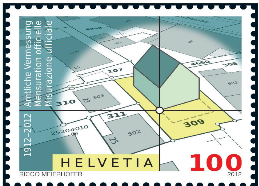
Sonderbriefmarke: Erstausgabetag 9. Mai 2012.