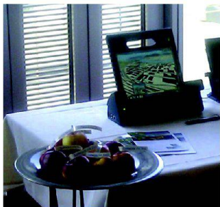
Soft- und Hardware «mit Biss».

Die Geomatiktage 2012 fanden am 26./27. April 2012 im Foyer des Stade de Suisse in Bern statt. Neben weiteren Ausstellern freute sich am 27. April auch die Asseco BERIT AG, dem interessierten Publikum ihre Soft- und Hardwarelösungen vorzustellen. Im Vordergrund der Produktpräsentation standen sicherlich die Motion Tablet PCs, welche die Asseco