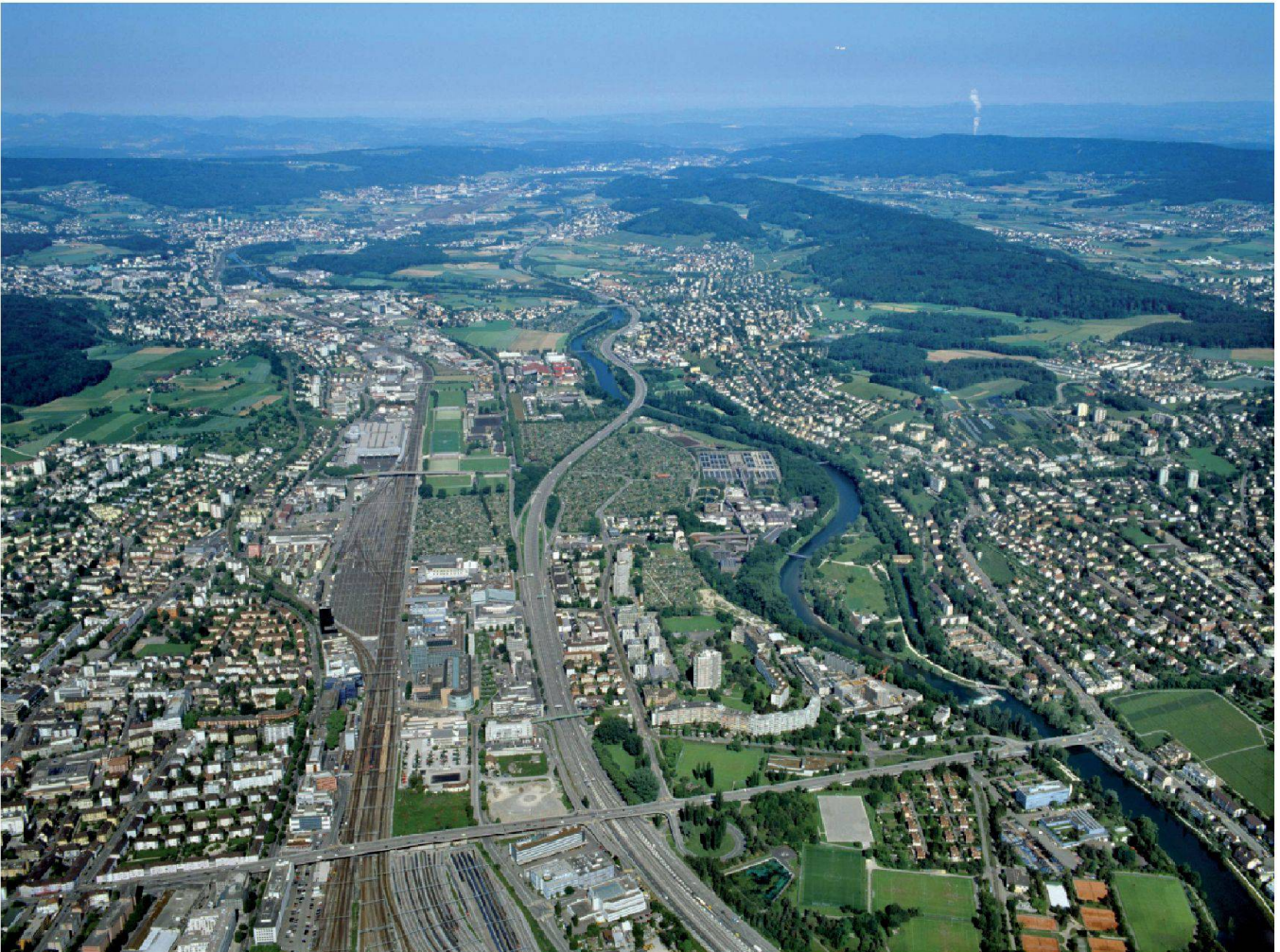
Abb. 2: Blick ins Limmattal, einem Raum von nationaler Bedeutung.

schätzung und Überprüfung raumbedeutsamer Entwicklungen neuartige Werkzeuge für experimentelle Simulationen wichtig.