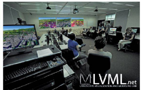
Abb. 3: Schwerpunkte in Forschung und Lehre der Professur für Planung von Landschaft und Urbanen Systemen (von links nach rechts): Modellierung der zukünftigen Bauzonenverteilung in Thun, visuell-akustische 3D-Landschaften von Windparks, Studierende im Landscape Visualization and Modeling Lab (LVML) .