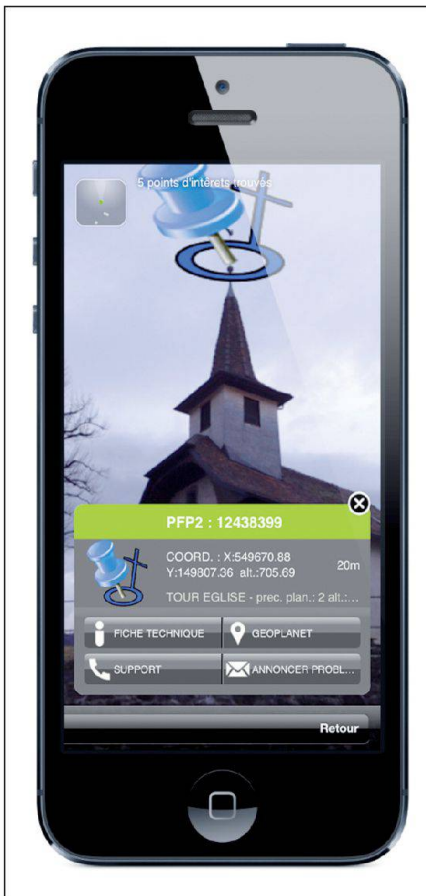
Fig. 2: Vue en réalité augmentée d'un PFP2 sur un clocher.

Abb. 2: Sicht in erweiterter Realität eines LFP2 auf einem Turm.