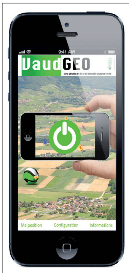
Fig. 1: Menu de VaudGeo. Abb. 1: Hauptmenü VaudGeo. Fig. 1: Menu di VaudGeo.

Développée dans le cadre d'un travail de diplôme de technicien en géomatique pour le compte de l'Office de l'Information sur le Territoire de l'Etat de Vaud, l'application VaudGeo est mise à disposition dès le début de l'automne 2013, et téléchargeable gratuitement sur l'App Store.