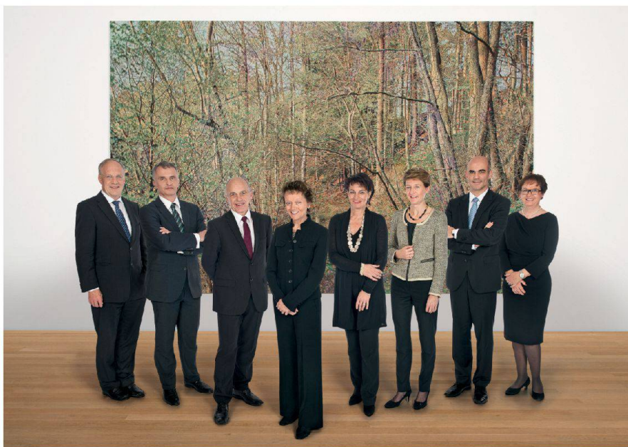
Abb. 2: Der Bundesrat steht zum Wald. Bundesratsfoto 2012.

Bezüglich Begrenzung des Waldeinwuchses reicht eine walddrechtliche Regelung allein nicht aus. Notwendig ist eine integrale Betrachtung, die auch die Raumplanung und die Landwirtschaftspolitik einbezieht. Das heisst, die laufenden Rechtsetzungsarbeiten in diesen Bereichen wie die beiden Teilrevisionen des Raumplanungsgesetzes und die Agrarpolitik 2014–2017 sind mit den Änderungen des Waldgesetzes auf geeignete Art