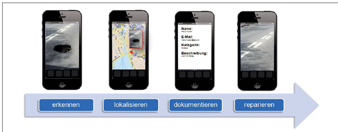
Abb. 1: Grundidee von «Züri wie neu».