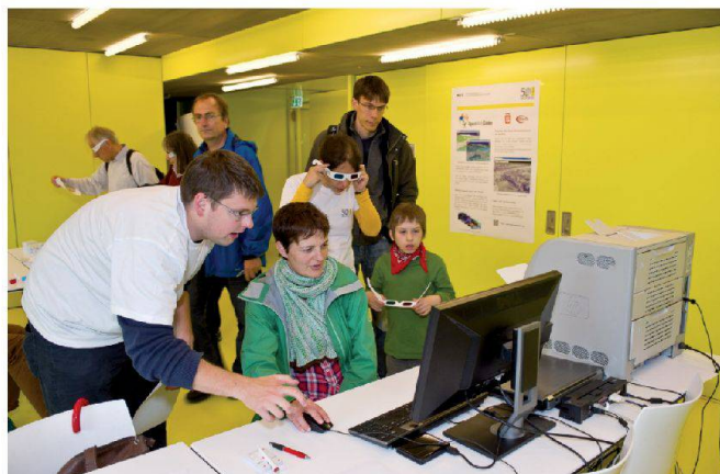
Abb. 5: Open Web Globe 3D in der Kantonbibliothek BL.