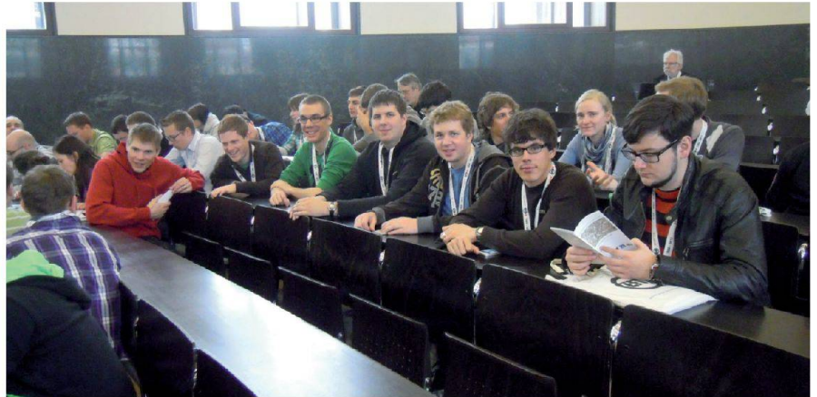
Abb. 1: Studierende des IVGI an der D-A-CH-Tagung in Freiburg/Breisgau.

Beim Institut Vermessung und Geoinformation (IVGI) stand im ersten Halbjahr des Jahres 2013 das 50-jährige Jubiläum von Institut und Studiengängen im Zentrum. Ende Februar fand mit allen Studierenden von Bachelor- und Masterstudiengang die von den Fachverbänden (IGS, geosuisse, GEO+ING STV, STV-Zentralvorstand und STV-Basel) gesponsorte Fachexkursion zur Dreiländertagung D-A-CH der Photogrammetrieverbände in Freiburg/Breisgau statt.