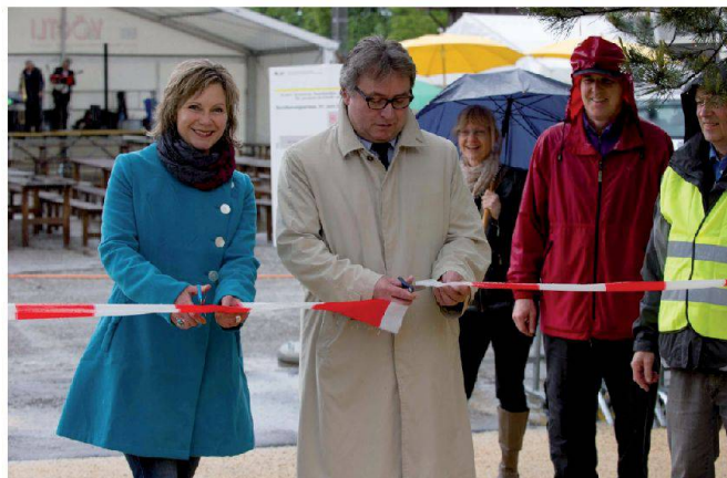
Abb. 3: Nationalratspräsidentin Maya Graf und Regierungsrat Urs Wüthrich beim Eröffnen des Parcours «Geomatik zum Anfassen».