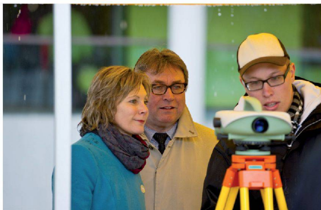
Abb. 4: Politik meets Messtechnik.