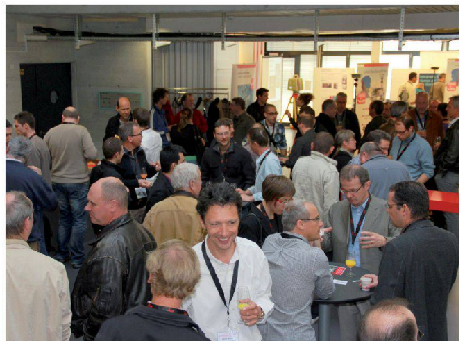
Santé et bon appétit!