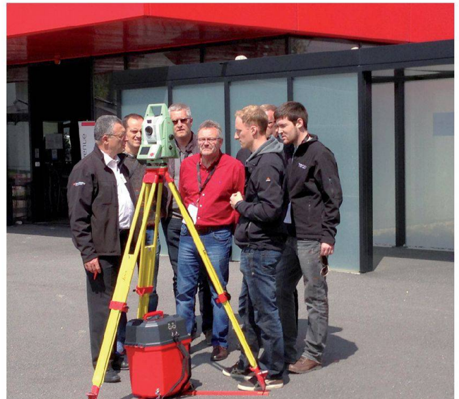
La nouvelle MultiStation MS50 en action.

Leica Geosystems SA Rue de Lausanne 60 CH-1020 Renens Téléphone 021 633 07 20 Téléfax 021 633 07 21 info.swiss@leica-geosystems.com www.leica-geosystems.ch