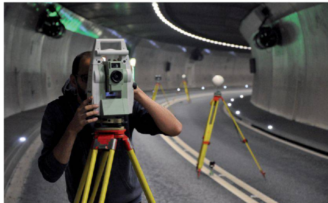
Netzausgleichung in der Tunnelvermessung, hier Gotschnatunnel © J. Engewald, Lutz Schmid Ingenieure AG.

Geodätische Grundlagennetze stellen eine wichtige Basis bei Bauprojekten dar. An die verwendete Ausgleichungssoftware werden dabei unterschiedlichste Anforderungen gestellt: Sie muss verschiedenste Messdaten aus Tachymetrie, GPS und Nivellement kombinieren können und diverse Varianten der Netzausgleichung (1D, 2D, 3D, weiche Lagerung, freier, gezwängter oder korrelierter Ausgleich) sowie Werkzeuge zur Netzanalyse bieten. Übersichtliche Protokollierung und grafische Darstellung des berechneten Netzes sorgen für einen raschen Überblick. All das bietet rmNETZ, die geodätische Ausgleichungssoftware von rmDATA. Mit ihr wurden bereits tausende Grundlagennetze für Baustellen weltweit bestimmt. Ausserdem findet das Programm im Kataster, in der Industrievermessung und diversen weiteren ingenieurgeodätischen Anwendungen seinen erfolgreichen Einsatz. Denn gerade die einfache Bedienung von rmNETZ überzeugt die vielen Anwender.