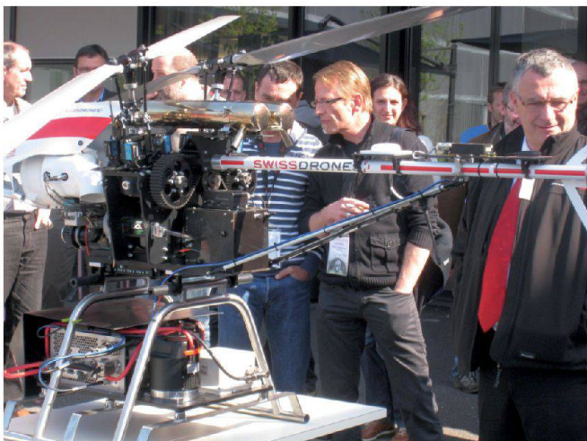
Le swissdrone Waran.