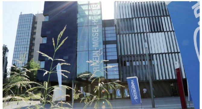
Eingang zur Rhein-Mosel-Halle, Koblenz.