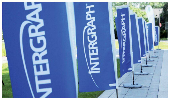
Intergraph-Flaggen-See vor der Rhein-Mosel-Halle, Koblenz.

Innovationen, zur Marktlage und Unternehmenspolitik von Intergraph. Bestehende Produkte und Lösungen, konkrete Anforderungen an die zukünftige Softwareentwicklung und aktuelle Problemstellungen werden hingegen in so genannten Nutzergruppen diskutiert. So richtet sich die vor wenigen Monaten gegründete G!NIUS-Nutzergruppe an Anwender der Softwarelösung G!NIUS von Intergraph, speziell bei Ver- und Entsorgungsunternehmen. Auf dem Intergraph-Forum 2013 wurde die G!NIUS-Nutzergruppe erstmals dem breiten Auditorium vorgestellt.