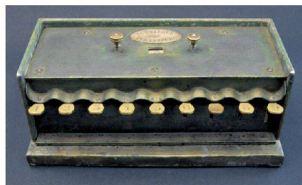
Abb. 2: Schwilgué-Tastenaddiermaschine aus Strassburg. Eine äusserst seltene Addiermaschine aus dem Jahr 1851 von Jean-Baptiste Schwilgué, dem berühmten Uhrmacher aus Strassburg (Schöpfer der letzten astronomischen Uhr des Strassburger Münsters). Die meisten führenden technisch-wissenschaftlichen Museen hatten bisher keine Kenntnis vom Schwilguéschen Gerät. Aufgetaucht in der Kulturgütersammlung der ETH Zürich am 28. Januar 2014.