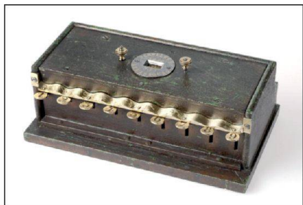
Abb. 3 und 4: Diese Schwilgué-Tastenaddiermaschine befindet sich im Historischen Museum in Strassburg.

lassen. Die geringe Stellenanzahl lässt sich durch den Verwendungszweck erklären. Nach Felix Feldhofer nimmt die Hubtiefe der Tasten von eins bis neun schrittweise zu, entsprechend weit werden die Zahnstangen bzw. -räder des Zählwerks bewegt. Masse: Breite 25,3 cm, Tiefe 13,5 cm, Höhe 9,5 cm. Gewicht: 3336 g.