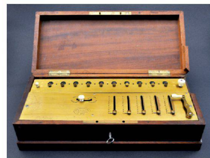
Abb. 1: Thomas-Arithmometer aus Paris. Ein Meilenstein in der Geschichte der Rechentechnik: Das am 28. Januar 2014 in der Kulturgütersammlung der ETH Zürich (wieder) gefundene 150-jährige Thomas-Arithmometer, eine Vierspezies-Staffelwalzenmaschine aus Messing und Holz.

Das Thomas-Arithmometer beherrscht alle vier Grundrechenarten Addition, Subtraktion, Multiplikation und Division (Vierspeziesmaschine). Es handelt sich dabei um eine Staffelwalzenmaschine (im Un-