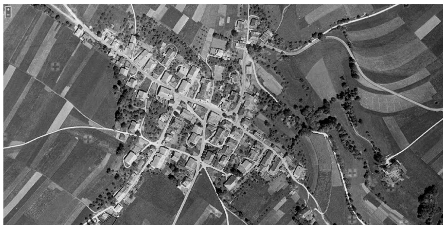
Fig. 3: Exemple de photo aérienne visualisée en pleine résolution (Nods BE, 1959, extrait).

sement et à la mise à jour des cartes nationales. Si de nombreux jeux de géodonnées de base de swisstopo se fondent sur elles aujourd'hui, les photos sont également utilisées par d'autres offices fédéraux, par divers services spécialisés et par des particuliers pour un large éventail d'applications. Elles servent par exemple de base à des études portant sur l'évolution du paysage et du tissu urbain, à des recherches menées dans les domaines de la nature et de l'environnement ou à la création de séries chronologiques d'images et d'orthophotos historiques. Du reste, une partie de la collection est