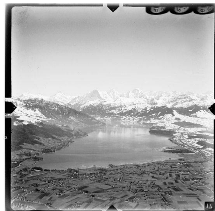
Fig. 4: Photo aérienne, prise de vue oblique: lac de Thoue, 1931 (Original: négatif sur plaque de verre, 13x13cm). Un exemple issu de la collection photographique de swisstopo qui sera accessible dans le cadre du plan de mesures adopté.

Les principes qui sous-tendent le nouveau visualiseur LUBIS sont les mêmes que ceux sur lesquels la version précédente se fondait. Ainsi, les photos aériennes sont