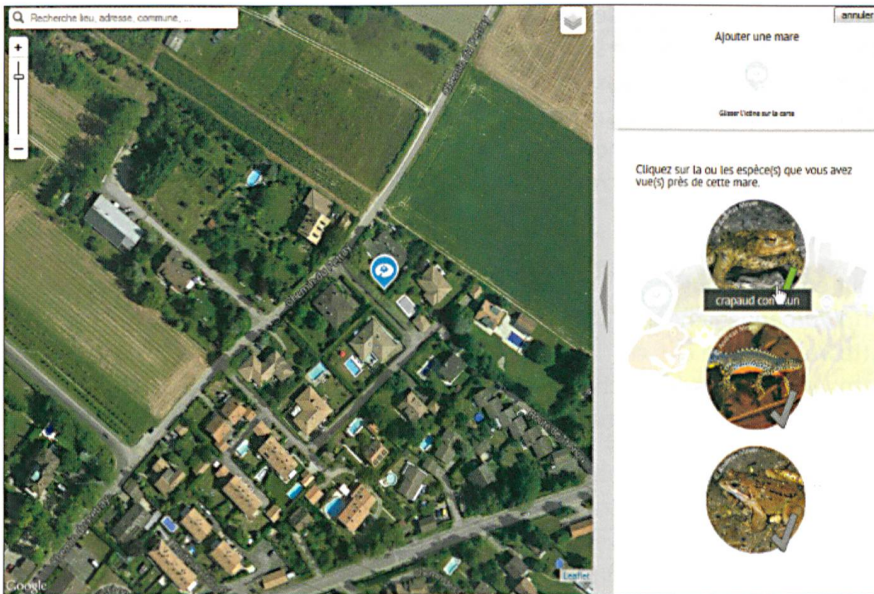
Fig. 1: La plateforme Urbangene.heig-vd.ch: saisie de mares.

recte. Un certain nombre d'acteurs stratégiques sont aujourd'hui sensibilisés aux enjeux du maintien de la biodiversité. Cependant, cet enjeu ne débordé que très peu la sphère des décideurs publics et la grande majorité de la population n'a qu'un rapport diffus avec cette notion. Il est donc important de créer une relation plus étroite entre les citoyens et la biodiversité.