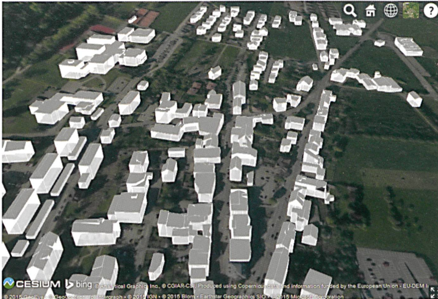
Fig. 2: Travail de Master N. Delley: maquette 3D dans un navigateur web.

à 7», guichet cantonal de suivi des projets, formation aux démarches participatives, modalités d'évolution du cadre réglementaire, etc.) afin de fluidifier les relations entre acteurs impliqués dans ces projets.