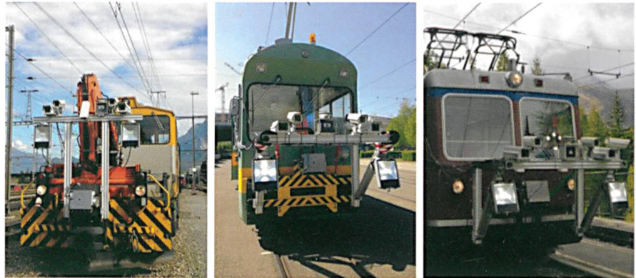
Abb. 3: Der Rail Track Scanner aus dem TQual-Projekt im Einsatz bei der Rhätischen Bahn, den Verkehrsbetrieben Zürich und der Gornergratbahn.

Im Projekt GeoAR zur Nutzung von Augmented Reality im Geoinformationskontext konnte 2015 die Entwicklung zweier innovativer AR Apps initialisiert werden: die Augusta Raurica AR App, eine mobile Anwendung für die zukünftigen Besucherinnen und Besucher der Römerstadt mit einer Reihe von AR-Funktionen sowie die Swissarena App, eine Augmented Reality App für die Swissarena im Verkehrshaus Luzern. Beide Apps sollen im