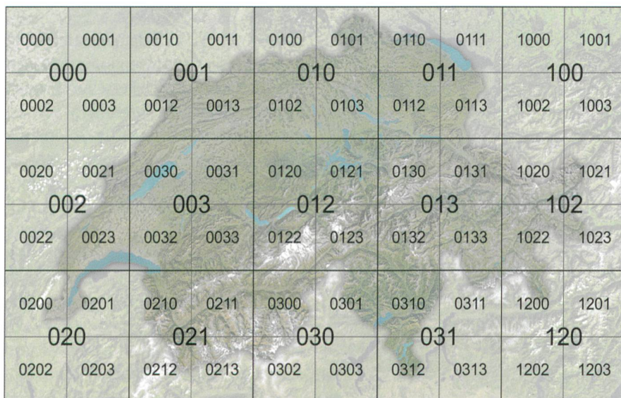
Abb. 2: Kacheleinteilung in LOD0 (dreistellig) und LOD1.

Durch die grosse Ausdehnung und die enorme Auflösung der Swissarena unterscheiden sich die Rahmenbedingungen gegenüber Standardanwendungen mit der markerbasierten AR-Technologie. Das Luftbild wurde in quadratische Kacheln aufgeteilt. Dadurch entstanden 15 Kacheln mit 8 m Seitenlänge. Durch deren Viertelteilung sind erneut Kacheln in unterschiedlichen Detaillierungsgraden (LOD0 mit 8 m bis LOD3 mit 0.5 m) entstanden (Abb. 2). Die Anzahl der LOD3 Kacheln beträgt 960 Stück.