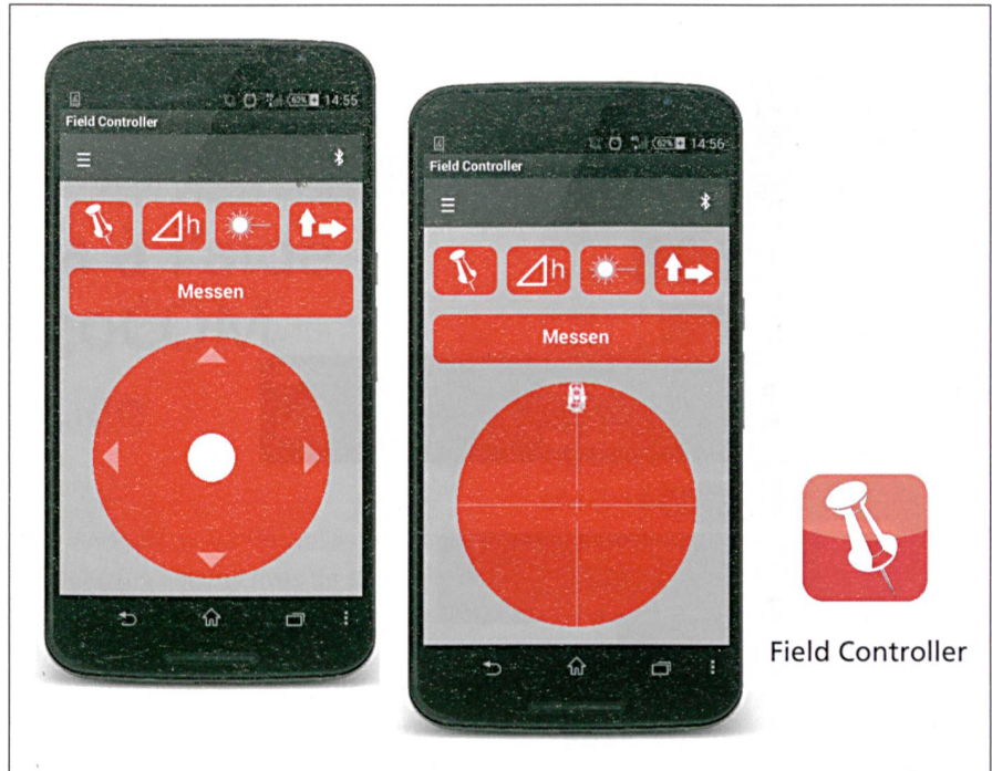
Abb. 2: Messen, Abstecken, Field Controller.

Nach ersten Versuchen mit dem App Inventor gilt es, die Problematik des Datentransfers von Daten- und Messjobs zu lösen. Es stehen verschiedene Lösungen zur Auswahl. Die Idee, Koordinaten in einer Textdatei zu speichern, wie es auch in der Praxis angewendet wird, wäre naheliegend. Die Fusion Tables-Funktionen im App Inventor bieten etliche Vorteile gegenüber den Textdateien. Der Datentransfer fällt weg (vom Büro und vom Gerät). Die Daten stehen nach jeder Messung sofort im Büro zur Verfügung.