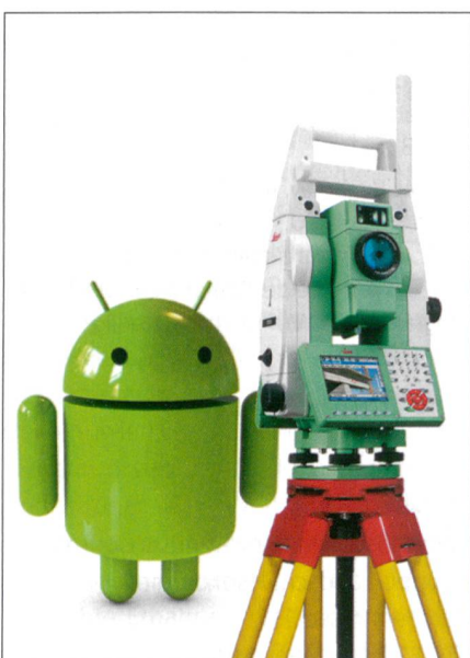
Abb. 1: Android-App.

Eine Alternative zum Android Studio ist der vom MIT (Massachusetts Institute of Technology) entwickelte App Inventor (AI), welcher auf der Google Code Engine aufbaut und somit als Cloud-Produkt jedermann gratis zur Verfügung steht. Der AI ist so erfolgreich, dass es ihn bereits in der Version 2 gibt. Alles, was es braucht,