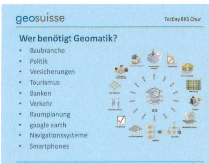
Abb. 2: Geomatikdaten werden von allen benötigt.