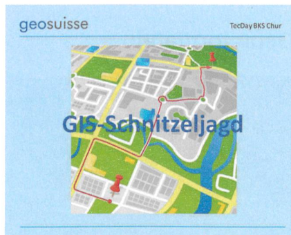
Abb. 3: Die GIS-Schnitzeljagd kann auf der Homepage von geosuisse abgerufen werden.