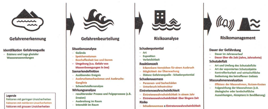
Abb. 1: Phasen in der Gefahrenbeurteilung und im Risikomanagement von Gletschergefahren mit dazugehörigen Teilschritten und Klassierung der Unsicherheit.

Häufig wiederholen sich Gefahrenprozesse an einem Gletscher. Informationen zu früheren Ereignissen sind daher sehr hilfreich. Liegen keine Informationen zu früheren Ereignissen vor oder hat sich die Situation seit den letzten Ereignissen relevant verändert, sind längerfristige Prognosen mit grossen Unsicherheiten verbunden. Dann muss auf Analysen, Annahmen und Analogieschlüsse zu ähnlichen Fällen abgestützt werden. Die Unsicherheiten sind entsprechend gross; oft bedeutend grösser als bei anderen Prozessarten. Weil Gefahrenbeurteilungen bei Gletscherhochwasser meist erst gemacht werden, wenn eine Gefahrenquelle neu entsteht, ist die Wahrscheinlichkeit gross, dass sie in kurzer Zeit anhand tatsächlicher Ereignisse überprüft werden kann – Chance für die Experten, ihre Überlegungen zu verifizieren, aber auch Fluch, weil Abweichungen Erklärungsbedarf gegenüber der Bevölkerung und Behörden nötig machen und die Glaubwürdigkeit der Experten leiden kann. Die grössten Unsicherheiten in der Gefahrenbeurteilung von Gletscherhochwasser liegen in der Festlegung der Szenarien. Die aus den Szenarien abgeleitete Wirkungsbeurteilung beinhaltet bedeutend weniger Unsicherheiten, weil es für die Ausbreitung der Prozesse heute gute Modellierungssoftware gibt. Auch die dazu notwendigen Höhenmodelle liegen in der Schweiz in hoher Genauigkeit vor.