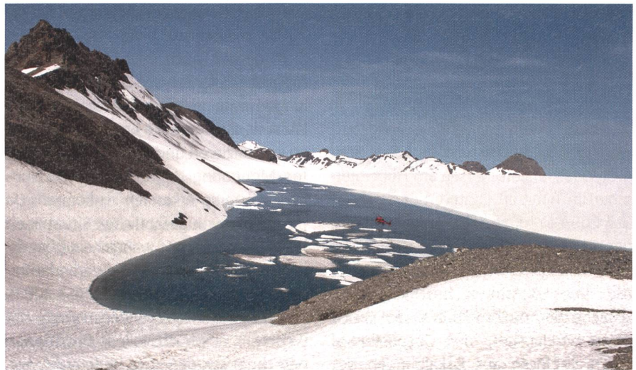
Abb. 4: Gletschersee Faverges auf der Plaine Morte an der Lenk 2012 (Bild: Oberingenieurkreis I, Nils Hählen).

In Bezug auf Schutzmassnahmen ist die Art und Exposition der Schutzgüter entscheidend. In Fällen, in denen v.a. Personen gefährdet sind, ist es zweckmässig, die gefährdeten Räume abzusperren,