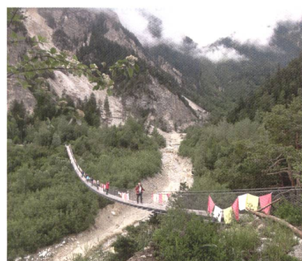
Abb. 2: Nicht in Buthan, sondern im Walliser Illgraben, dem wohl bekanntesten Wildbach der Schweiz.