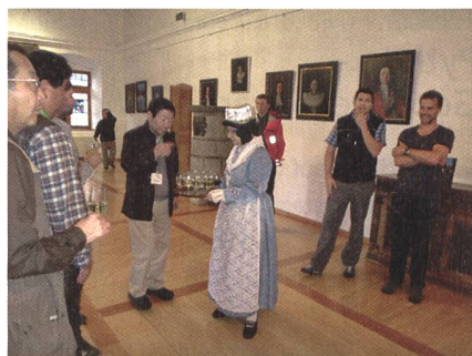
Abb. 4: Im Briger Stockalper Palast.