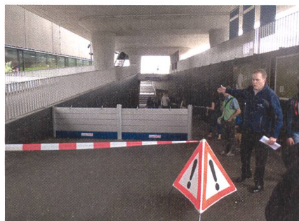
Abb. 3: Objektschutz gegen das Hochwasser der Sihl mit mobilen Elementen in der Stadt Zürich.