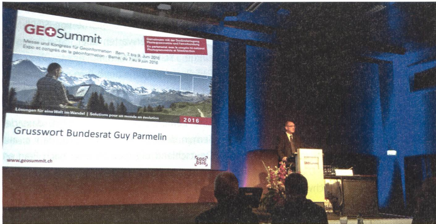
Abb. 3: Grusswort von Bundesrat Guy Parmelin zum gemeinsamen Abschluss des GEOSummit und der Dreiländertagung.

Am 9. Juni folgte der zweite Teil des wissenschaftlichen Programms wieder mit drei parallelen Vortragssessionen zu den Themen «Sensoren und Plattformen – Kamerasysteme», «Auswertung von Fernerkundungsdaten» und «Optische 3D-Messtechnik». Nach der Kaffeepause endeten die wissenschaftlichen Vorträge dann mit den Themen «3D-Stadtmodelle», der Fortsetzung von «Auswertung von Fernerkundungsdaten» sowie «Aus- und Weiterbildung».