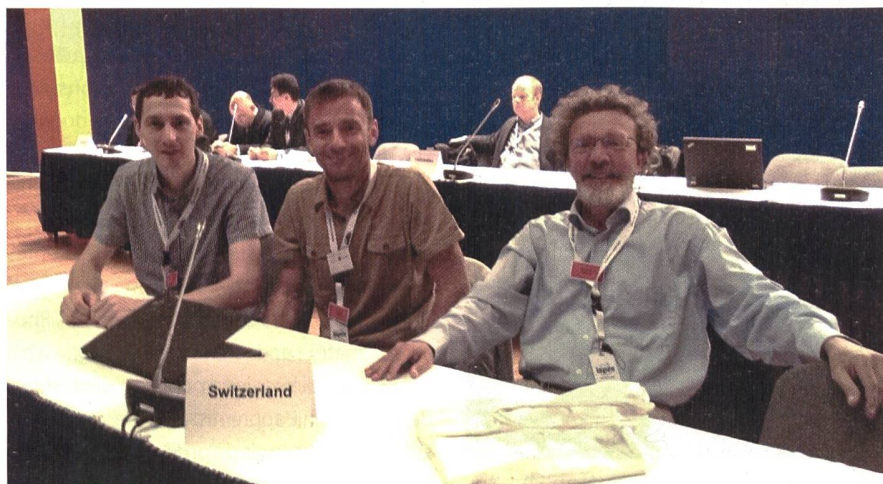
Switzerland was represented at the General Assembly by the SGPF.