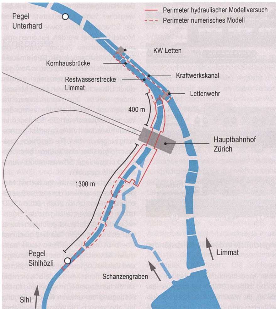
Abb. 1: Untersuchungsgebiet Sihldurchlässe (VAW, mod. nach EWZ).

chen Veränderungen. Für die Untersuchung der Abflusskapazität der Sihldurchlässe wurde daher zwischen dem Zustand 2006 – vor dem Bau der DML – sowie dem Zustand 2014 – nach Abschluss der Bauarbeiten – unterschieden.