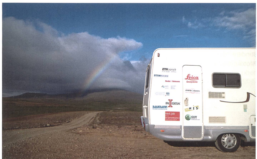
Übernachten im Naturschauspiel: Eines der beiden Wohnmobile im Nirgendwo.

Das Land verfügt über zwei formelle Planungsebenen: die nationale und die kommunale. Auf erstgenannter wurde kürzlich eine «National Planning Strategy» in einem partizipativen Prozess ausgearbeitet. Das Land wurde dabei in vier räumlich charakteristischen Gebieten, namentlich den «Central Highlands», die ländlichen, die urbanen und die marinen Gebiete, betrachtet. Die planerischen