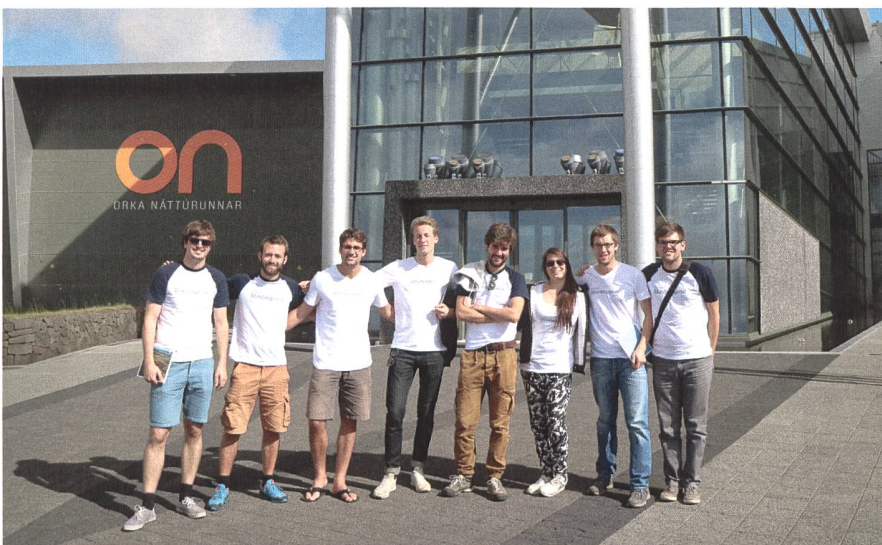
Lehrreiches über die Geothermie: Die Masterreisenden vor dem Kraftwerk Hellisheidi.

Durch den Besuch der zwei geothermischen Kraftwerke Hellisheidi und Reykjanesvirkjun erhielten wir wertvolle Informationen über die industrielle Nutzung der Geothermie. Mit Hilfe der insgesamt