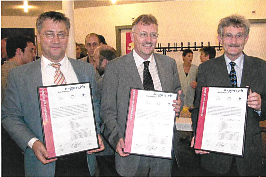
Abb. 2: Unterzeichnung Charta e-geo.ch, 2004. Fig. 2: Charte e-geo, signé 2004.

der Artikel 75a Vermessung in der Bundesverfassung mit folgendem Inhalt: