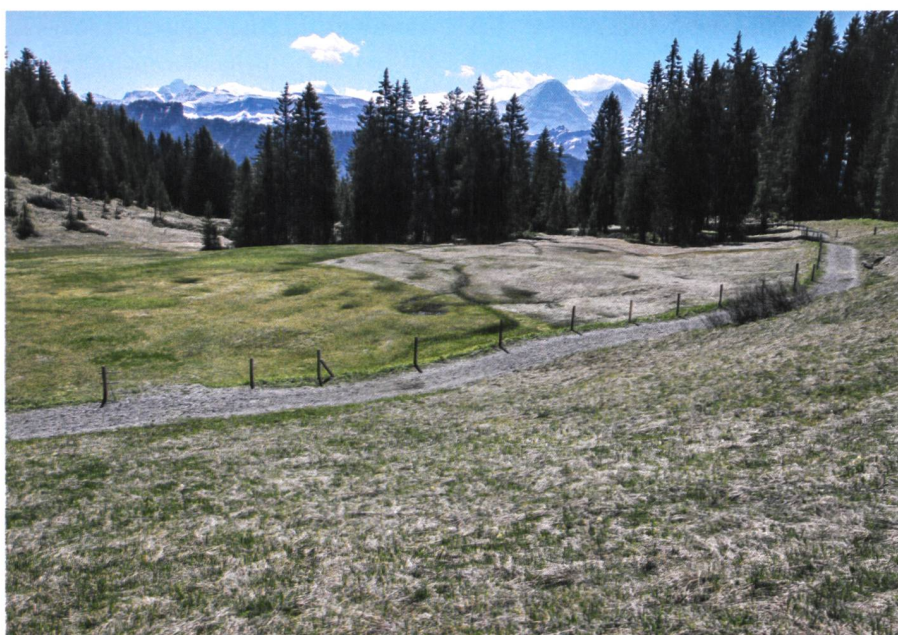
Fig. 1: Situation typique d'un chemin agricole traversant une zone de biotopes marécageux (Stouffe, commune de Habkern, BE).

Sono state messe a confronto tre tipologie di strade costruite per assicurare un approvvigionamento idrico diffuso nei biotopi palustri. Nelle strade realizzate con drenaggi a L a intervalli regolari le acque di deflusso si concentrano troppo all'uscita dei drenaggi. Quelle realizzate con tronchi di legno garantiscono un deflusso diffuso ma richiedono scavi che potrebbero deviare l'acqua sull'asse della strada se questa è in pendenza. Le strade a struttura leggera (vetro espanso) consentono un deflusso uniforme senza scavi.