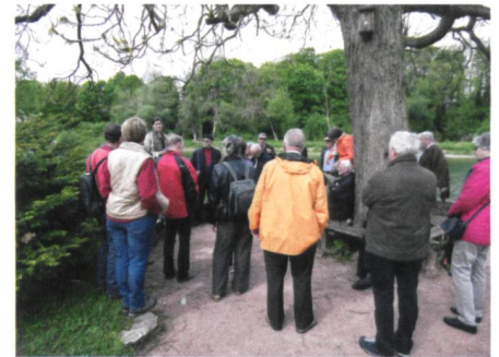
Abb. 3: Aufmerksame Zuhörer im Bally-Park.

etwa zwanzig Minuten zunächst steil bergauf, dann eben auf einem Waldweg und zum Schluss über unzählige Treppenstufen wieder hinunter zur Aussichtsplattform, von der man einen ausgezeichneten Blick auf die Baustelle der Tagbaustrecke des Eppenberg-Tunnels hat und die laufenden Bauarbeiten verfolgen kann. Nach kurzer Zeit war bereits der Rückweg angesagt, um den Bus zurück nach Schönenwerd und zum Schlussstrunk zu erreichen. Dieser Schlussstrunk fand wieder im Hotel Storchen statt. Begleitend zu einem Feierabendbier, einem Glas Wein oder Mineralwasser und Partybrötchen erzählten uns die Damen von ihrem Besuch im Gugelmann Museum und den dort ausgestellten poetischen Maschinen in Betrieb. Damit war der Schlusspunkt des diesjährigen Frühlingsanlasses der Gruppe Senioren erreicht; wiederum angereichert mit vielen gemütlichen, kollegialen Gesprächen mit bekannten und bisher unbekannt Personen. Die positiven Rückmeldungen lassen ohne weiteres den Schluss zu, dass solche Anlässe unter Senioren sehr geschätzt werden.