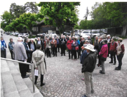
Abb. 1: Begrüssung im Bally-Park.

Zum Frühlingsanlass der Gruppe Senioren trafen sich 49 Teilnehmende, davon 16 Partnerinnen, im östlichsten Zipfel des Kantons Solothurn: in Schönenwerd. Auf dem Programm standen ein Besuch im Bally-Park und auf der Tunnelbaustelle Eppenberg, alternativ für weniger Bauinteressierte ein Besuch im Gugelmann Museum.