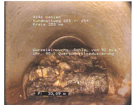
Abb. 1: Bei Kanal-TV festgestellter Wurzelaufwuchs.

besondere um die beiden Weltkriege herum sind viele Anlagen erstellt worden. Oftmals haben diese deshalb das Ende ihrer Lebensdauer bereits erreicht. Ohne Sanierung vernässen die betroffenen Flächen mit der Zeit wieder und sind dann nur noch eingeschränkt landwirtschaft-