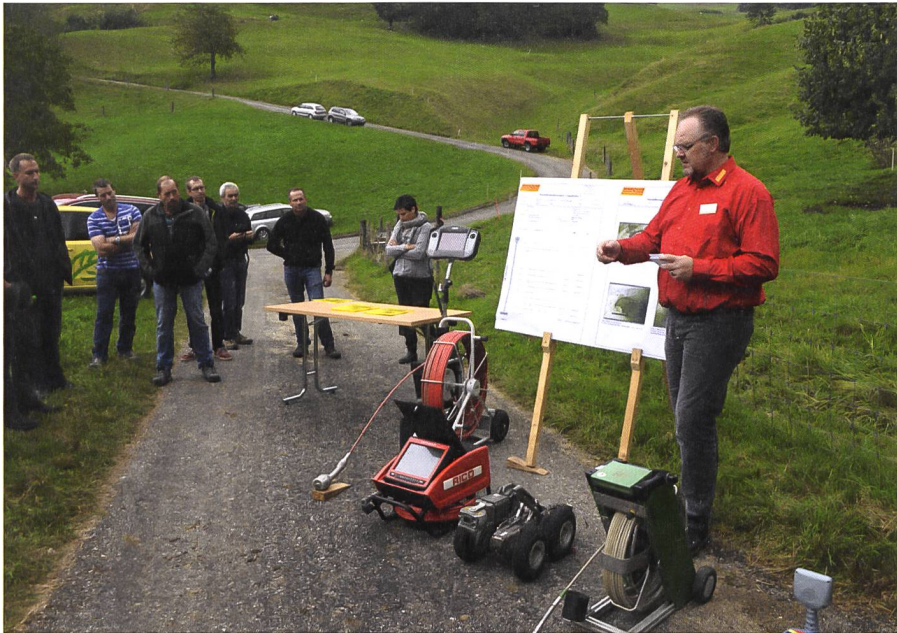
Abb. 4: Demonstration des Kanal-TV an der Unterhaltstagung in Eptingen.

Auslöser hierfür können Veränderungen der Bodenstruktur (z.B. Verdichtung, Sackung) und die damit zusammenhängende Beeinträchtigung des Bodenwasserhaushaltes sowie Änderungen in der Gesetzgebung sein. Eindolungen dürfen beispielsweise heutzutage abgesehen von wenigen Ausnahmen nicht mehr erneuert werden (Artikel 38 des Bundesgesetzes über den Schutz der Gewässer). Stattdessen ist das Fliessgewässer zu revitalisieren, wenn die Dole ihr Lebensende erreicht hat.