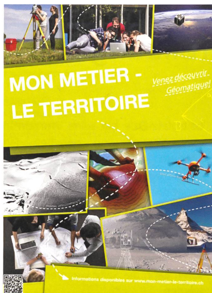
Fig. 2: www.mon-metier-le-territoire.ch .

rer Zeit steht sämtlichen Organisationen unsere Weiterbildungsplattform offen. Auf dieser können Kurse und Veranstaltungen selbstständig eingetragen werden und mit Ablauf der Anmeldefrist fällt diese aus dem «Bildungskalender». Wo findet sich diese Weiterbildungsplattform? Wählen Sie den