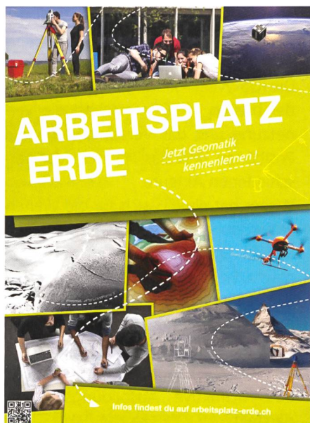
Abb. 2: www.arbeitsplatz-erde.ch .