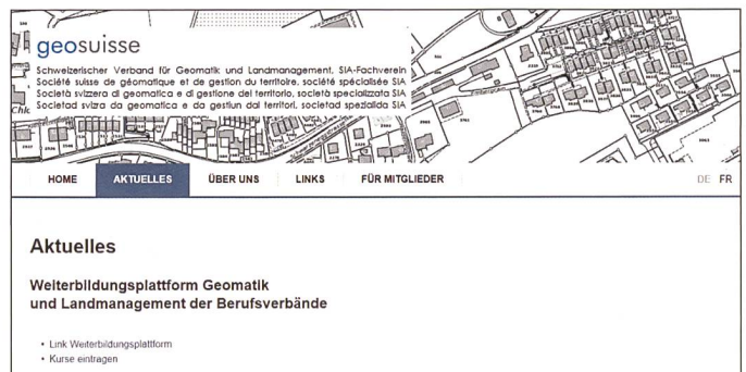
Fig. 5: Website geosuisse. Abb. 5: Website geosuisse.