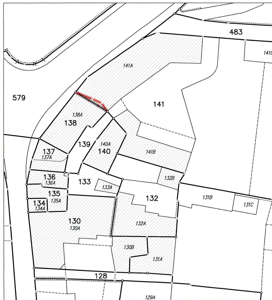
Exemple – Relevé erroné, d'un mur mitoyen. Fehlerhafte Erhebung, Trennmauer. Rilevamento errato, situazione di un muro promiscuo.

Notre état de droit possède une constitution fédérale. Toutes les lois visant à faire respecter les droits réels reposent sur l'art. 26 «Garantie de la propriété». Un autre article important a récemment intégré la constitution: l'article 75a «Mensuration». Il définit les missions de la Confédération