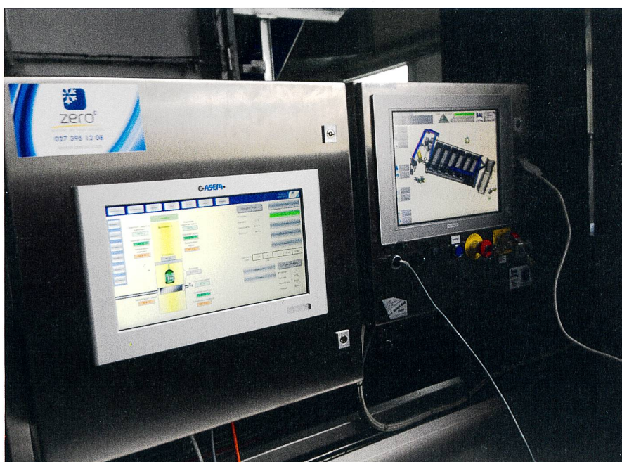
Fig. 2: Commande de contrôle automatique.