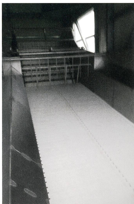
Fig. 6: Tapis de réception des plantes.

Les plantes dosées tombent ensuite sur un tapis épierreur incliné de structure particulière laissant rouler les pierres et accrochant les plantes pour les acheminer au-dessus de la coupeuse des plantes fraîches. Un système de tapis roulant en partie télescopique achemine les plantes vers les cellules de séchage. Un autre tapis roulant muni d'un racleur mobile se charge de faire tomber les plantes régulièrement en couche dans les cellules pour un remplissage homogène.