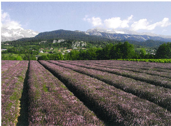
Fig. 4: Plantes aromatiques.