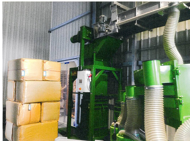
Fig. 5: Supplément tampon et conditionnement.

plantes fraîches, un système de transfert vers les cellules de séchage (tapis roulants), 8 cellules de séchage, un émetteur, un système de transfert vers la zone de conditionnement, une presse (mise en balles) et des tableaux de commandes.