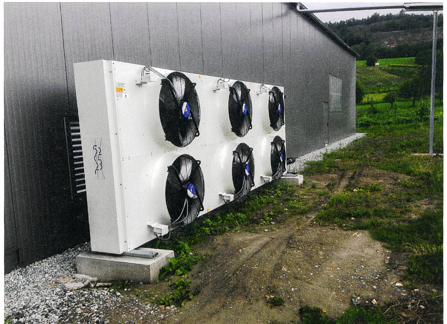
Fig. 8: Ventilation.

Grace aux réflexions et essais menés, il a été constaté qu'il était possible de sécher des plantes de manière optimale sans système de déshydratation de l'air en raison des conditions climatiques valaisannes. Cela permet des économies d'énergie de