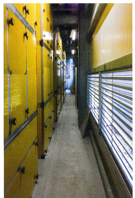
Fig. 3: Modules de déshydratation.