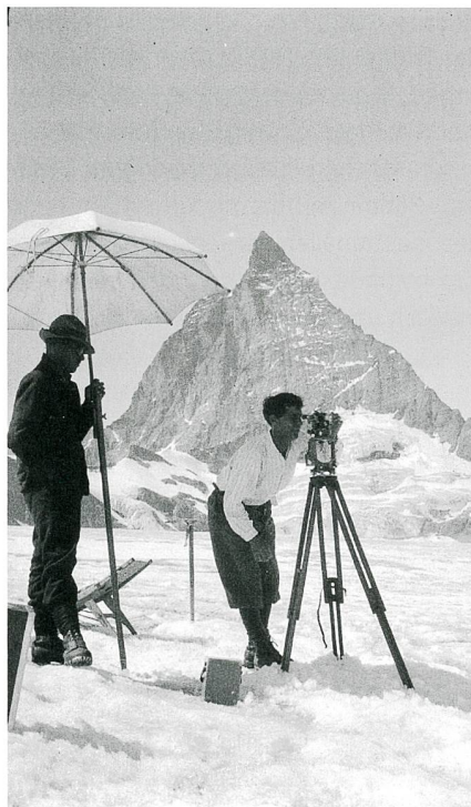
Abb. 1: Theodulgletscher: Fotogrammetrische Station, 1930.

Die terrestrischen Aufnahmen wurden im Rahmen des Massnahmenplans zur Erhaltung des raumrelevanten Kulturguts von swisstopo gescannt. Die verschiedenen damals erfassten historischen Parameter (z.B. die Orientierungen der Aufnahmen)