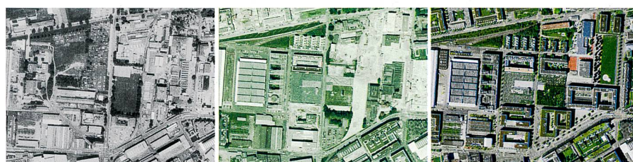
Fig. 4: Développement du quartier Oerliker Park (1982, 2002, 2016).

En plus des changements dans le paysage au fil du temps, le «voyage dans le temps – images aériennes» révèle l'évolution des prises de vue aériennes ainsi que les différentes méthodes de production. Les transitions entre le noir et blanc et la couleur, les différentes résolutions au sol ainsi que les différentes précisions