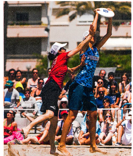
Abb. 2: Immer voller Einsatz, auch wenn es manchmal nicht nach Wunsch klappt...

So dreht sich mein sportliches und berufliches Leben seit über 20 Jahren um diese zwei Welten; Frisbee und Geomatik. Doch haben diese etwas gemeinsam? Auf den ersten Blick eigentlich nicht, aber beim genaueren Hinschauen irgendwie schon, denn wie die Frisbee-Spieler beantworten Personen aus der Geomatik-Branche sehr oft die Frage «Geomatik, was ist das?!» und wie beim Frisbee kennt man sich in der «Szene» und kann mit dem nötigen Willen und Einsatz auch sehr viel erreichen. Für mich hat sich Sport und Arbeit immer positiv beeinflusst, denn neben Zähne