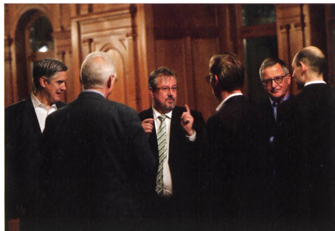
Abb. 2: Angeregte Diskussion mit SIA-Präsident Stefan Cadosch und Nationalrat Beat Flach.

Vergleich zu vorindustriellen Werten (1850-1900). Der Beitrag der Schweiz: Reduktion der CO 2 -Emissionen um 50 % bis 2030 gegenüber 1990. Ohne Massnahmen müssen wir mit einem Temperaturanstieg von 3,2 Grad bis 5,4 Grad rechnen. Heute sind es