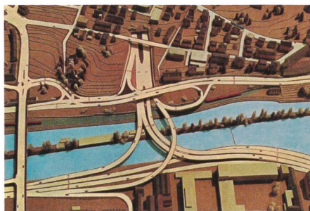
Abb. 3: Das Modellbild der Expressstrasse von 1970 zeigt, wie die Autobahnen über der Badi Letten hätten verknüpft werden sollen.

Der obere Stock führt die Besucherinnen und Besucher in die Gegenwart. Hier steht die Langstrasse im Zentrum, ein urbaner Kosmos mit ganz unterschiedlichen Facetten, wie die Kuratoren sagen. Mit diesem Kosmos haben