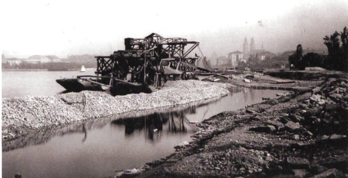
Abb. 1: Zwischen 1882 und 1887 lässt Arnold Bürkli im Zürcher Seebecken Land aufschütten für öffentliche Parkanlagen.

Die ausgestellten Pläne, Skizzen, Broschüren, Modelle, Fotos, Abstimmungsplakate sowie Inventarblätter von Gebäuden der Stadt Zürich, die wie ein Band die Ausstellung durchziehen, eröffnen vielfältige Zugänge zum Thema «Anarchiv» nennen die Kuratoren das Ausstellungsformat. Damit bezeichnen sie ein Archiv, das sich zu einer neuen Ordnung zusammenbringen lässt. Eindrücklich sind die Konvolute unter dem Titel «Die gescheiterte Moderne». Nach dem Zweiten Weltkrieg ging es nicht mehr um den Entwurf einer neuen Stadt, sondern um die Steuerung des Urbanisierungsprozesses durch Verkehrsprojekte. Solche wurden zum strategischen Instrument, die Stadt mit der Region zu verknüpfen. Die Basis bildete der «Generalverkehrsplan». Legendär sind Projekte wie das Expressstrassen-Ypsilon, die U-Bahn oder der City-Ring. Die-