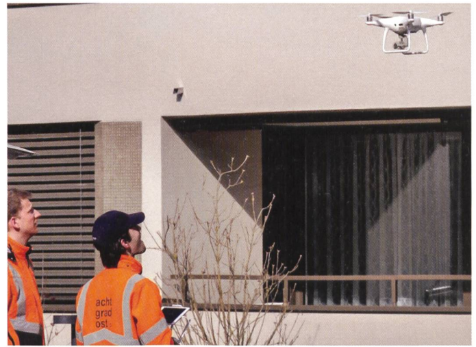
Abb. 4: Start Drohnenbildflug.

Punkte als umso zeitaufwändiger», zieht Michelle Meile, die kurz vor dem Lehrabschluss steht, ein Fazit.