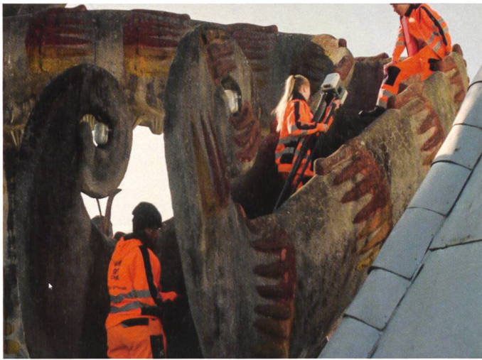
Abb. 3: Messung Doppel-Flügelhund.