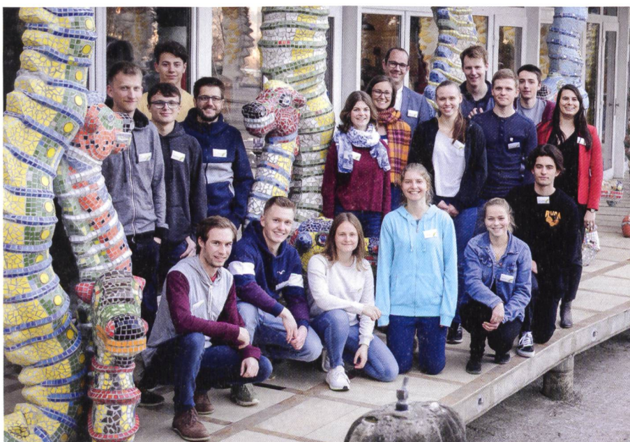
Abb. 1: Gruppenbild Lernende Acht Grad Ost mit Betreuerinnen und Betreuern.

An der Schlussveranstaltung im Bruno Weber Park präsentierte auch die Gruppe «3D-Objekterfassung» ihre Arbeit einem breiteren Publikum wie Eltern, Mitarbeitenden sowie weiteren Interessierten. Diese Gruppe erfasste mit dem neuesten Modell eines Laserscanners den Doppel-Flügelhund – eine der grössten Skulpturen im Bruno Weber Park. Aus der gemessenen Punktwolke wertete sie ein 3D-Modell dieser 110 m langen Betonskulptur aus. «Dieses komplexe Objekt konnten wir im Feld relativ zügig vermessen. Dafür erwies sich die Auswertung der über eine Milliarde