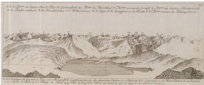
Fig. 3: Vue panoramique autour du lac de Zoug, in Instructions pour un voyageur qui se propose de parcourir la Suisse... , Johann Gottfried Ebel, Bâle, Tourneisen, 1795.

reconnaissance à la base du tourisme culturel ne fonctionnent pas autrement. Une fois de retour chez soi, si l'on se prend à regarder les images du guide de voyage, c'est pour se souvenir ou pour comparer, si cette fonction est clairement atténuée à notre époque où l'on photographie à tout va, elle devait être beaucoup plus forte au XIX e siècle, et permettre aux voyageurs de retrouver, grâce aux gravures des guides, les émotions ressenties sur le moment, quand ils se trouvaient face aux Alpes ou dans le lacet vertigineux d'une route de montagne.