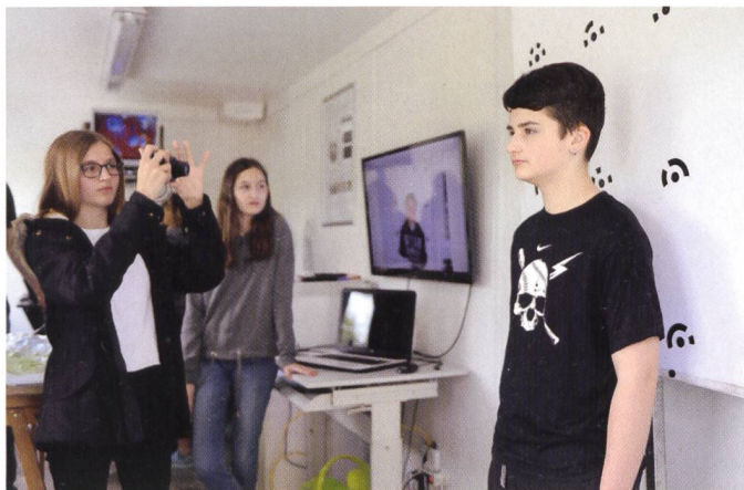
Abb. 4: Erstellen eines 3D-Porträts mit mehreren Bildern aus verschiedenen Betrachtungswinkeln.