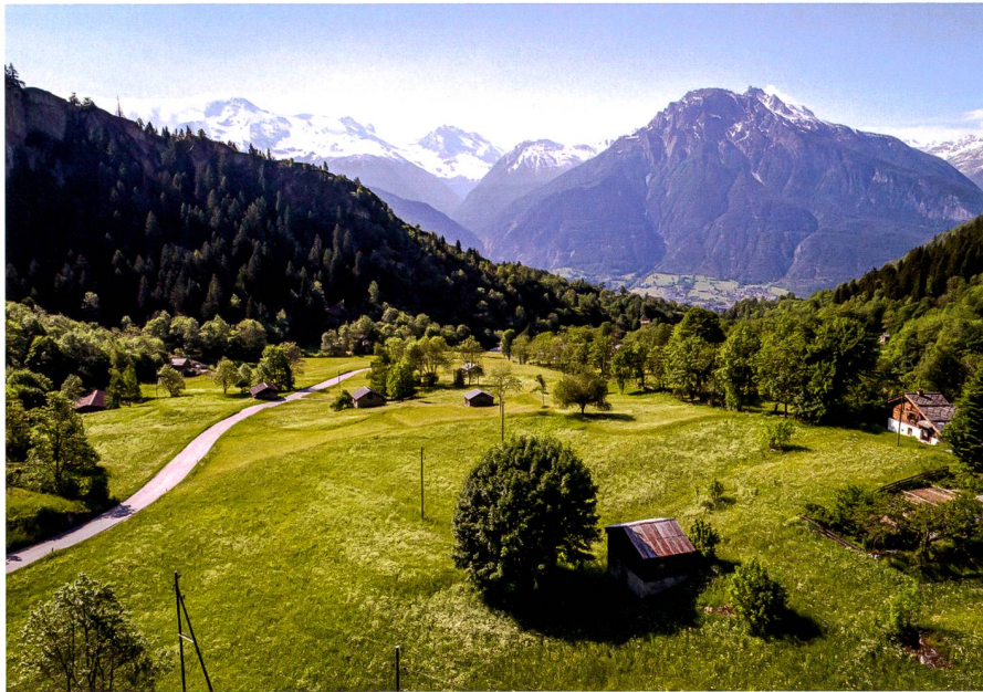
Abb. 2: Hangbewässerungslandschaft am Natischerberg.

anlagen (Beregnung) weitere Modernisierungen der Bewässerung. Die Umstellung der Bewässerung auf Beregnung betraf ab 1950 vor allem die Spezialkulturen, ab 1970 auch teilweise die Naturwiesen. Gleichzeitig wurde im Zuge des landwirtschaftlichen Strukturwandels und der damit in bestimmten Regionen einhergehenden Extensivierung oder Aufgabe der Nutzung die Bewässerung an einigen Orten aufgegeben (Gerber & Papilloud 2015). In diesem Zusammenhang begannen erste Wasserwasserleitungen zu zerfallen und damit auch die typische Bewässerungslandschaft zu verschwinden.