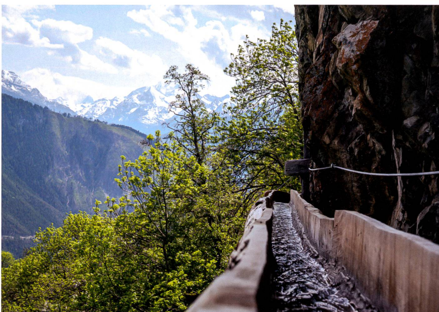
Abb. 3: Das Steiwasser in Mund.

Das traditionelle Bewässerungssystem ist neben der landwirtschaftlichen Funktion nicht nur ein wertvolles Kulturgut, sondern auch bezüglich Biodiversität und Landschaftsqualität von grosser Bedeutung: Durch die Erschaffung eines engmaschigen Geflechts von trockenen und feuchteren Standorten entsteht eine Vielzahl von Lebensräumen. Auch der Bergwald profitiert vom Suonenwasser, sei dies nun in Form von aktiver Bewässerung im Sinne des Brandschutzes, wie es an neuralgischen Stellen teilweise gemacht wird, oder sei es durch Diffusion durch die immer leicht durchlässigen Suonenwände. Dank der Bewässerungswirtschaft wird die Vergandung und Vertrocknung der Flächen verhindert, was neben dem Erhalt der vielfältigen Kulturlandschaft dem Schutz vor Naturgefahren und wiederum dem Brandschutz dient. Wässerwasserleitungen sind auch für die Hangentwässerung bei Starkniederschlä-