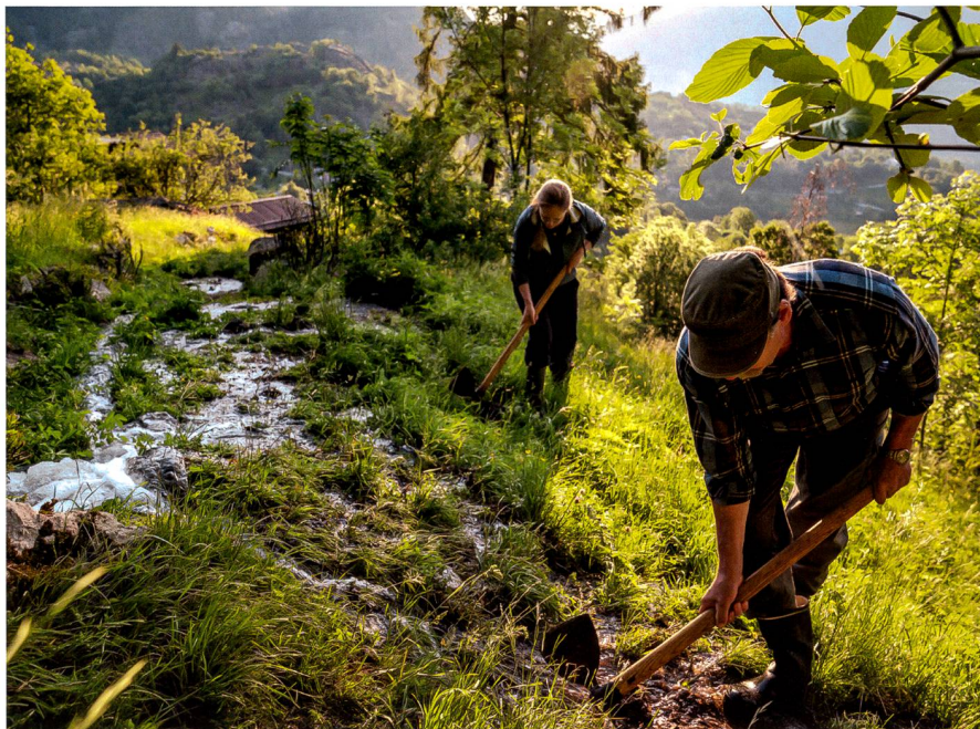
Abb. 4: Feinverteilung des Wassers auf den Wiesen.

In Ausserberg : Die Gemeinde Ausserberg, welche im Jahr 1914, nach grossen Zerstörungen an den Suonen im Baltschiederatal, die Verantwortung für den Erhalt der Bewässerungskanäle übernommen hat und heute immer noch trägt; der SAC Blümlisalp (Sektion Ausserberg), welcher sich nach Erstellung des Stollens für die Suone Niwärch im Jahr 1972 verpflichtet hat, den jährlichen Unterhalt (Gemeinwerk) für den historischen Lauf der Ni-