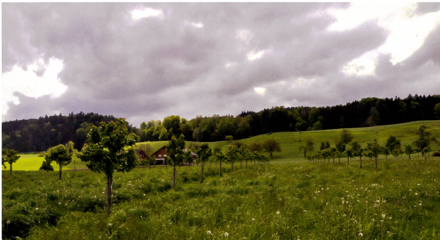
Abb. 2: Mehr als 2500 Kirschen Hochstammbäume wurden während der Projektzeit 2011 bis 2018 gepflanzt.

Kantone Zug, Luzern und Schwyz sowie vom Bund mit Beiträgen unterstützt. Die kantonalen und nationalen Stellen fördern damit nicht nur die lokale Landwirtschaft, sondern stärken neben den regionalen Produkten auch die Werte der Standortmarken Zug (vertreten durch den Kanton Zug) und Rigi (vertreten durch die Kantone Luzern und Schwyz). Die Auszeichnungen der Standortmarken «Zuger Kirsch» und «Rigi Kirsch» mit der geschützten Ursprungsbezeichnung (AOP-IGP) und der «Zuger Kirschtorte» mit der geschützten geographischen Angabe (GGA) stärken den Wert der regionalen Produkte und der Standortmarken Zug und Rigi. Für die Herstellung der Zuger Kirschtorte darf ausschliesslich Zuger