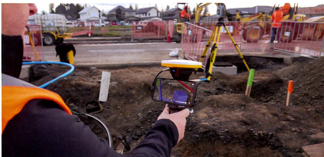
Einbaukontrolle und gleichzeitige Dokumentation.

In jedem Bauprojekt stecken besondere Herausforderungen. Beim Werkleitungsbau beispielsweise liegt eine besonders grosse darin, dass nur kurze Zeit ans Tageslicht tritt, was lange Jahre zuverlässig unter der Erde funktionieren muss. Gearbeitet wird in Gräben, wo sich meist viele Leitungen wenig Platz teilen. Gleich komplex wie die Situation, sind die Baupläne und komprimiert darauf die Informationen. Passieren beim Bauen Fehler, müssen sie umgehend erkannt und korrigiert werden, weil nur wenig später die fertiggestellten Leitungsabschnitte wieder zugeschüttet werden. Entsprechend eng getaktet sind auch die Qualitäts- und Fortschrittskontrollen. Zudem muss für eine optimale Projektdokumentation im schnellen Rhythmus punktgenau festgehalten werden, was später wieder aufgefunden werden soll.