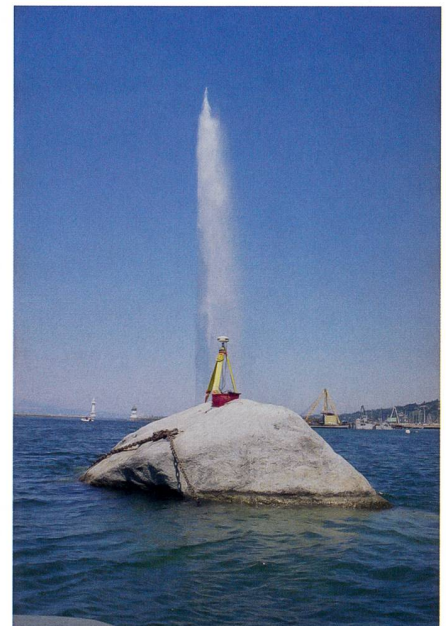
Abb. 1: Die wohl erste GNSS-Messung im Jahre 1996 auf RPN anlässlich des Diplomvermessungskurses der ETH Zürich.

Für die geodätischen Grundlagen der Schweiz hat RPN nach wie vor eine besondere Bedeutung. Er dient als realer Fundamentalpunkt für die offiziellen Höhen in der Schweiz, den sog. Gebrauchshöhen LN02, und gleichzeitig als Höhen-Aus-