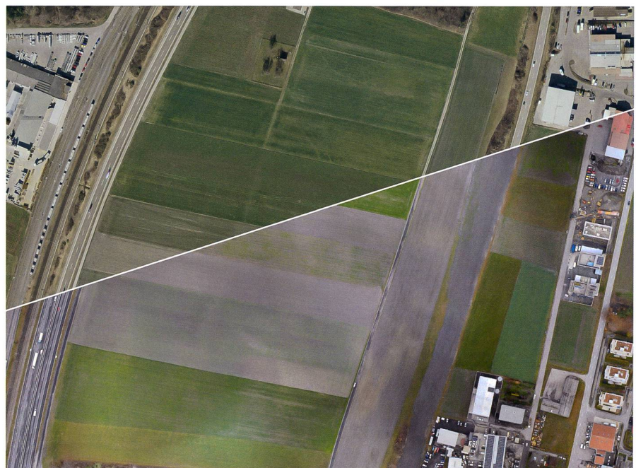
Abb. 2: Vergleich der Orthofotos von 2014 (oben) und Dezember 2018 (unten), Neubau Nordspur (links) und Rekultivierung altes Trasse (rechts).

Die Teilmelioration Trimmis beinhaltet zusätzlich zum Landumlegungsverfahren auch den Aus- und Neubau eines einheitlichen und den heutigen Anforderungen angepassten Güterstrassennetzes (Abb. 3). Im Rahmen der baulichen Umsetzung wurden landwirtschaftliche Güterstrassen und Bewirtschaftungswege mit einer