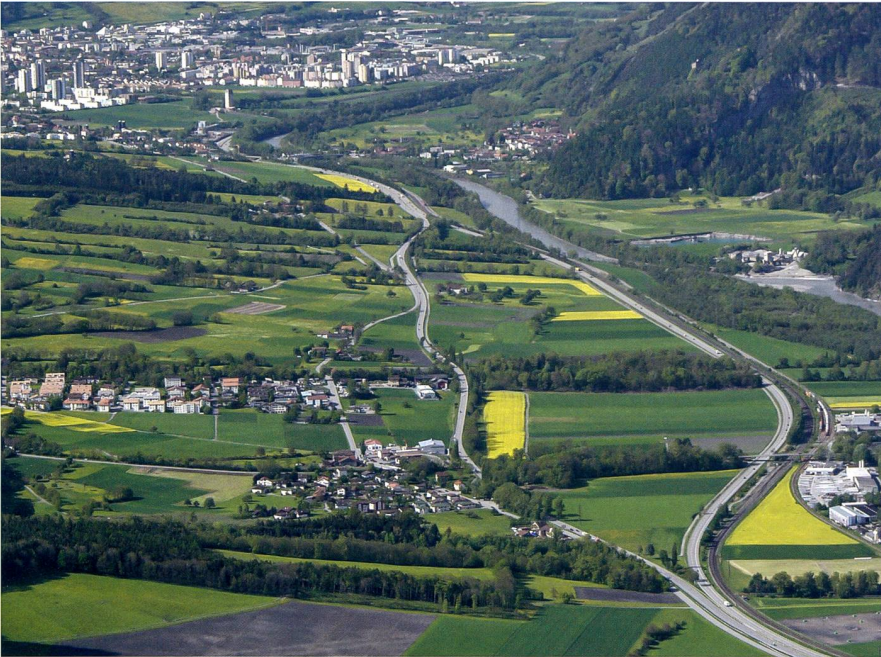
Abb. 1: Nationalstrasse A13 bei der Verzweigung Trimmis/Untervaz, Blick in Richtung Süden.

schen der Süd- und ehemaligen Nordspur der A13 von der Gemeindegrenze Chur/Trimmis bis zum Anschluss Zizers/Untervaz. Die landwirtschaftliche Nutzfläche im Beizugsgebiet wird von insgesamt 15 Betrieben bewirtschaftet. Haupterwerbszweig ist die Milchproduktion, daneben wird in grossem Umfang Ackerbau und Aufzucht betrieben.